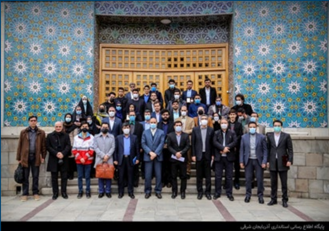
پارک اطلاع رسانی استانداری آذربایجان شرقی